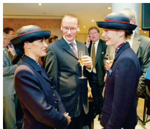
Dvije domaćice British Airwaysa ugošćuju ključne klijente na njih organiziranom domjenku.

sti nekoliko različitih računalnih programa za kupnju, što često uzrokuje konfuziju. Na osnovu analize, tvrtka British Airways centralizirala je proces kupnje i nametnula korištenje standardnog računalnog programa za kupnju. Zahvaljujući ovim dvama potezima, očekivali su uštedu od 650 milijuna dolara u periodu od tri godine.